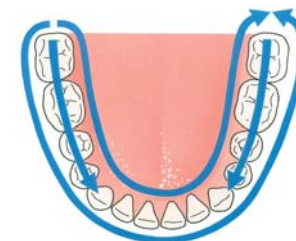
Houd een vaste poetsvolgorde aan

Poets altijd tand voor tand en volgens de 3 B's: Binnenkant, Buitenkant en Bovenop!