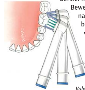
Volg de vorm van uw tanden en kiezen

Deze folder geeft u een heldere poetsinstructie voor het roterende systeem. De poetstechniek voor de sonische variant wijkt hiervan af. Kijk daarvoor in de gebruiksaanwijzing van uw elektrische tandenborstel. Zet de borstel onder een kleine hoek op het tandoppervlak net over de tandvleesrand. Oefen weinig druk uit. Zodra de borstel contact maakt met het tandoppervlak reinigt de borstel al. Houd de borstel enkele seconden stil op de tand of kies, zodat de borstel ook tussen uw tanden en kiezen komt. De borstel maakt zelf de poetsbeweging.